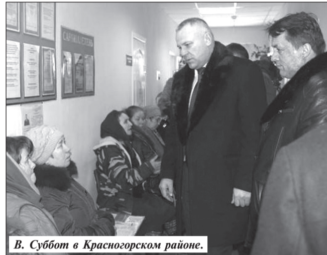
В. Суббот в Красногорском районе.

Депутат взял на контроль вопрос о строительстве площадки для