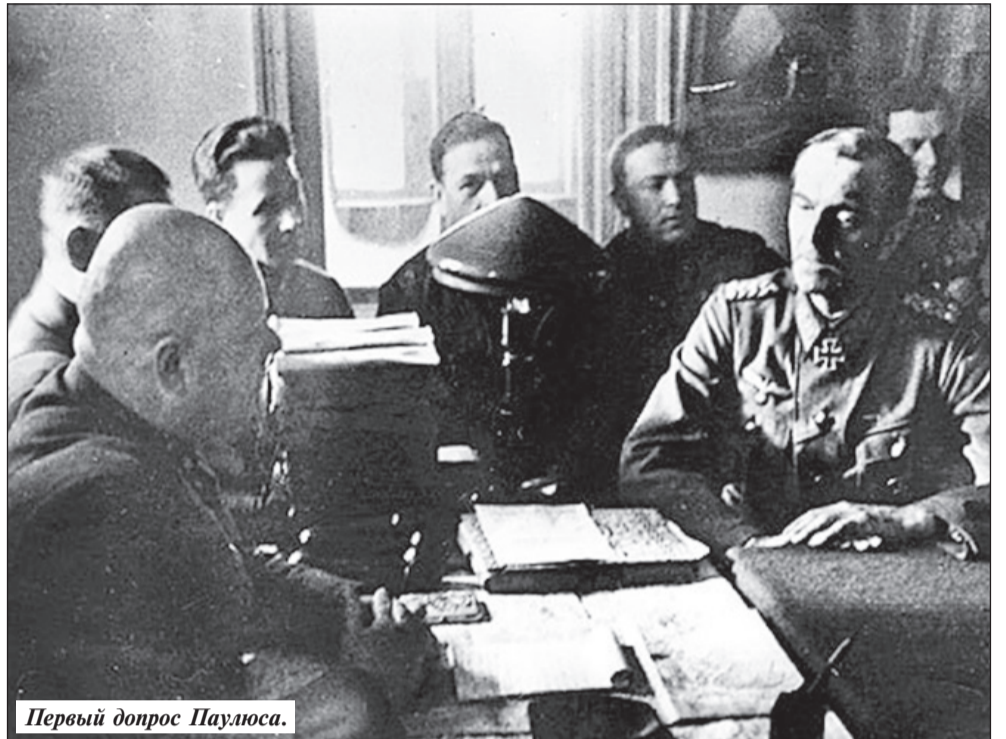
Первый допрос Паулюса.

Генерал Росске заявил, что командующий Паулюс передал ему полномочия по ведению переговоров. Я потребовал немедленной встречи с Паулюсом. «Это невозможно», — заявил Шмидт. — Командующий возведен Гитлером в чин фельдмаршала, но в данное время армией не командует. К тому же он нездоров». Молнией мелькнула мысль: «Может быть, здесь идет какая-то